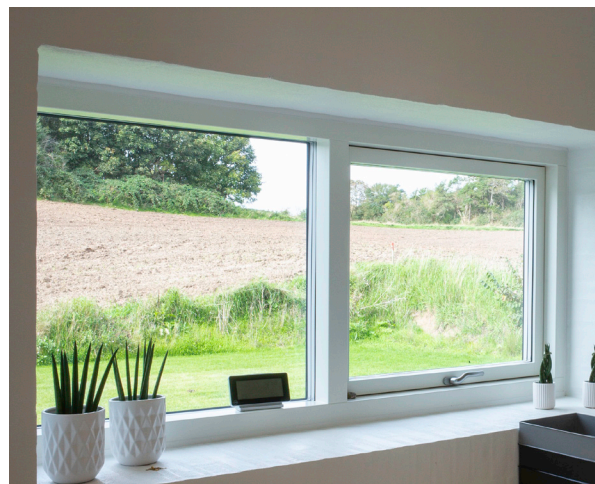
KRONE COTO 62 // TRÆ/ALU