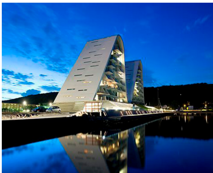
KRONE COTO 62 // TRÆ/ALU