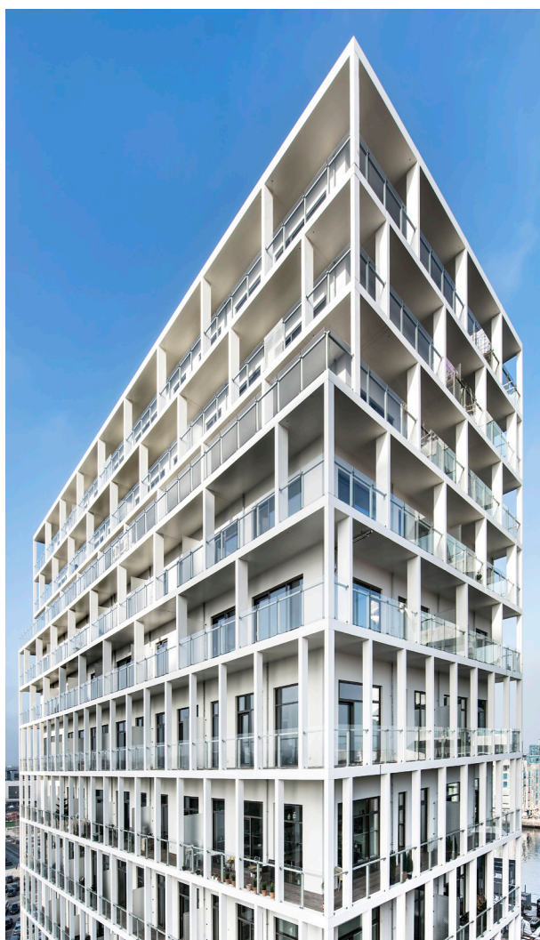
KRONE COTO 62 // TRÆ/ALU