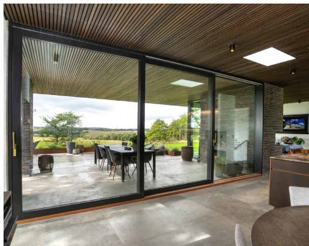
SKYDEDØR // 3-FLJØJET TRÆ/ALU