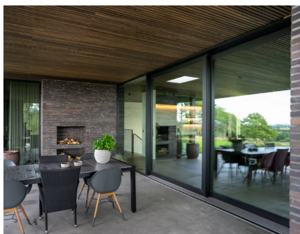
SKYDEDØR // 3-FLJØJET TRÆ/ALU