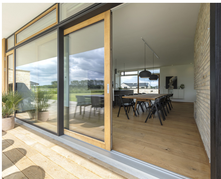
SKYDEDØR // EGETRÆ