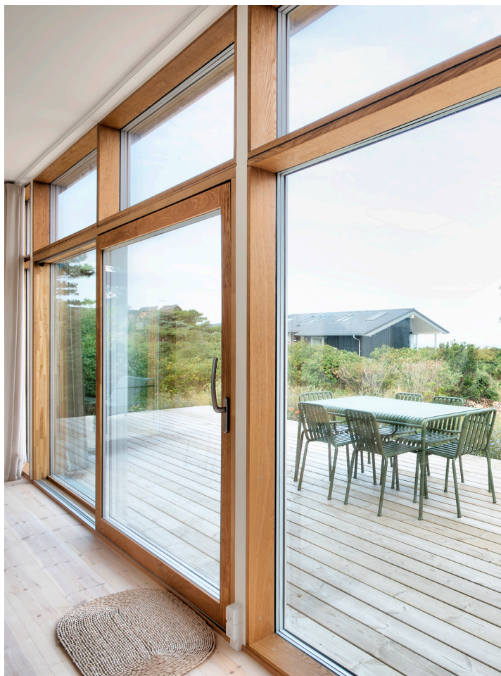
SKYDEDØR // TRÆ/ALU