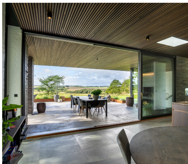
SKYDEDØR // 3-FLJØJET TRÆ/ALU